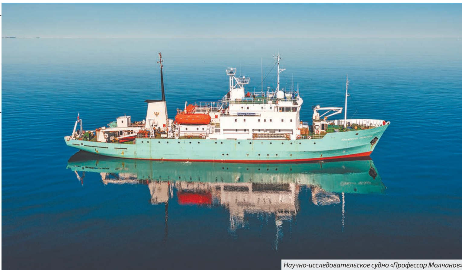
Научно-исследовательское судно «Профессор Молчанов»