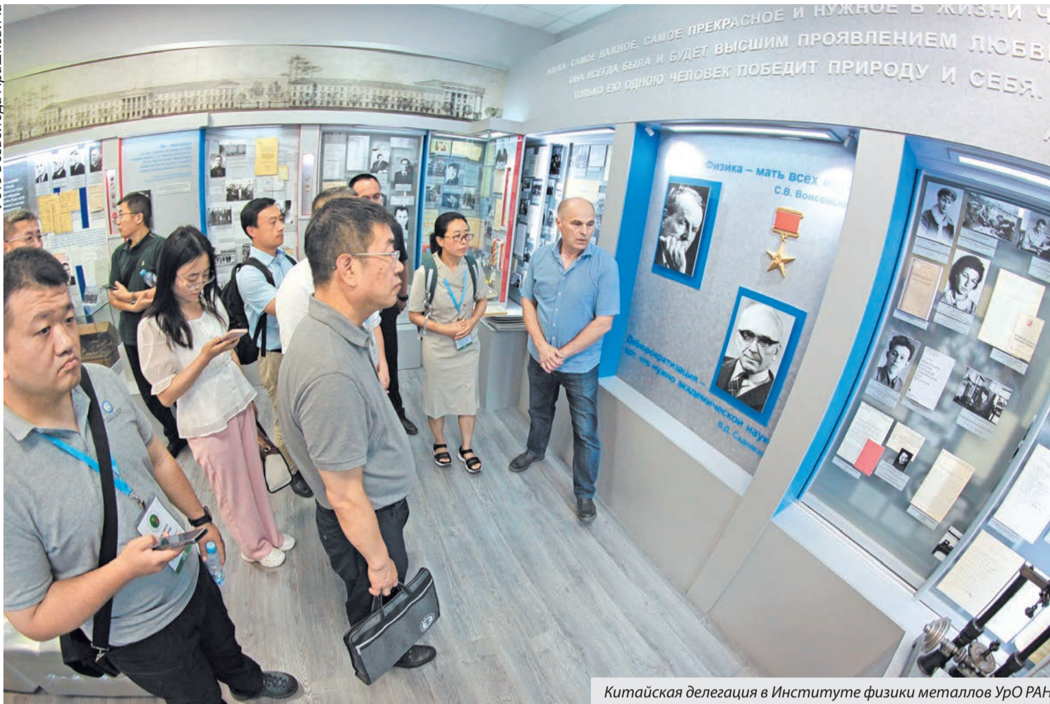
Китайская делегация в Институте физики металлов УрО РАН