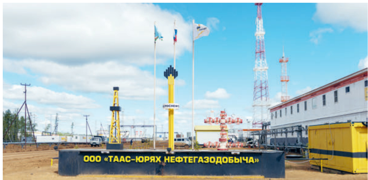
Особое внимание «Роснефть» уделяет реализации совместных проектов компании и индийских партнеров. Среди этих проектов «Сахалин-1», «Таас-Юрях» и «Ванкорнефть».