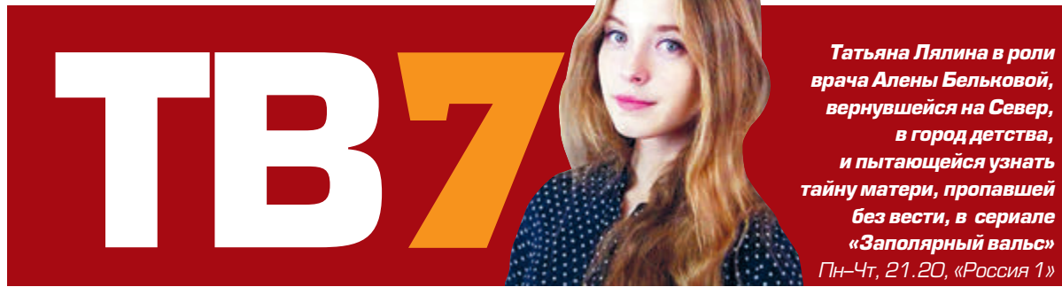
Татьяна Лялина в роли врача Алены Бельковой, вернувшейся на Север, в город детства, и пытающейся узнать тайну матери, пропавшей без вести, в сериале «Заполярный вальс» Пн-Чт, 21.20, «Россия 1»