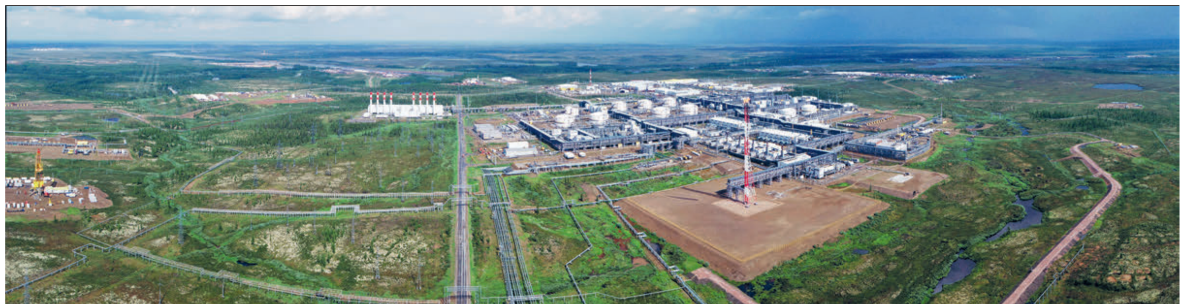
«Восток Ойл» является флагманским проектом «Роснефти», одним из самых перспективных в мировой нефтегазовой отрасли.

После визита Игоря Сечина в Индию и подписания нового поставочного соглашения акции «Роснефти» выросли на Московской бирже до полугодичного максимума, достигнув 387 рублей за штуку