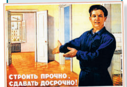
СТРОИТЬ ПРОЧНО. СДАВАТЬ ДОСРОЧНО!

— Не думаю, что такая инициатива добавляет прозрачности. Хорошо бы понимать, какие именно чиновники станут получать льготную ипотеку — между прочим, за счет народа. За какие заслуги? А пока у меня вопросы к тому, насколько идея опирается на Конституцию. Все же чиновники — не каста, живущая по особым правилам. У меня есть ощущение, что предложение по ипотеке — всего лишь лоббизм застройщиков. Рынок стоит, людям надо как-то крутиться.