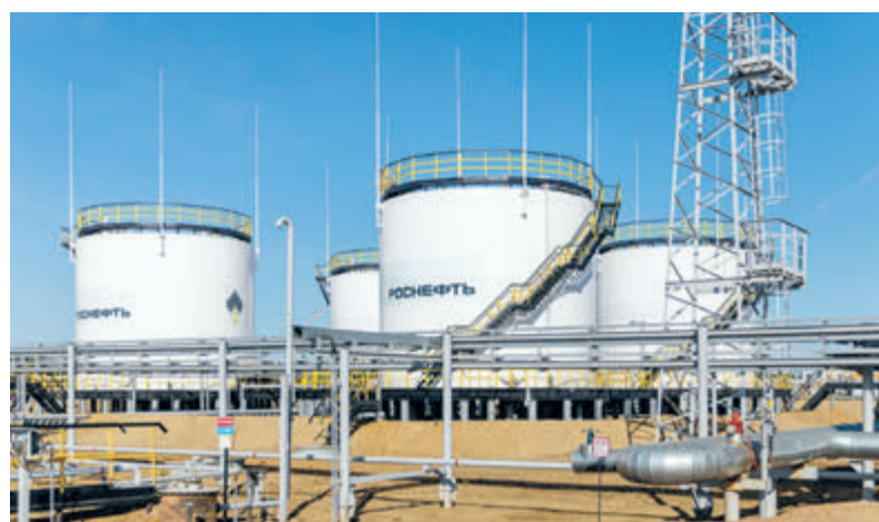
КННК получила возможность приобрести миноритарные доли в крупных нефтегазовых проектах «Роснефти», расположенных в том числе в Восточной и Западной Сибири.

«Роснефть» и КННК на протяжении почти двух десятилетий являются надежными партнерами, и это сотрудничество имеет стратегический характер. «Наши