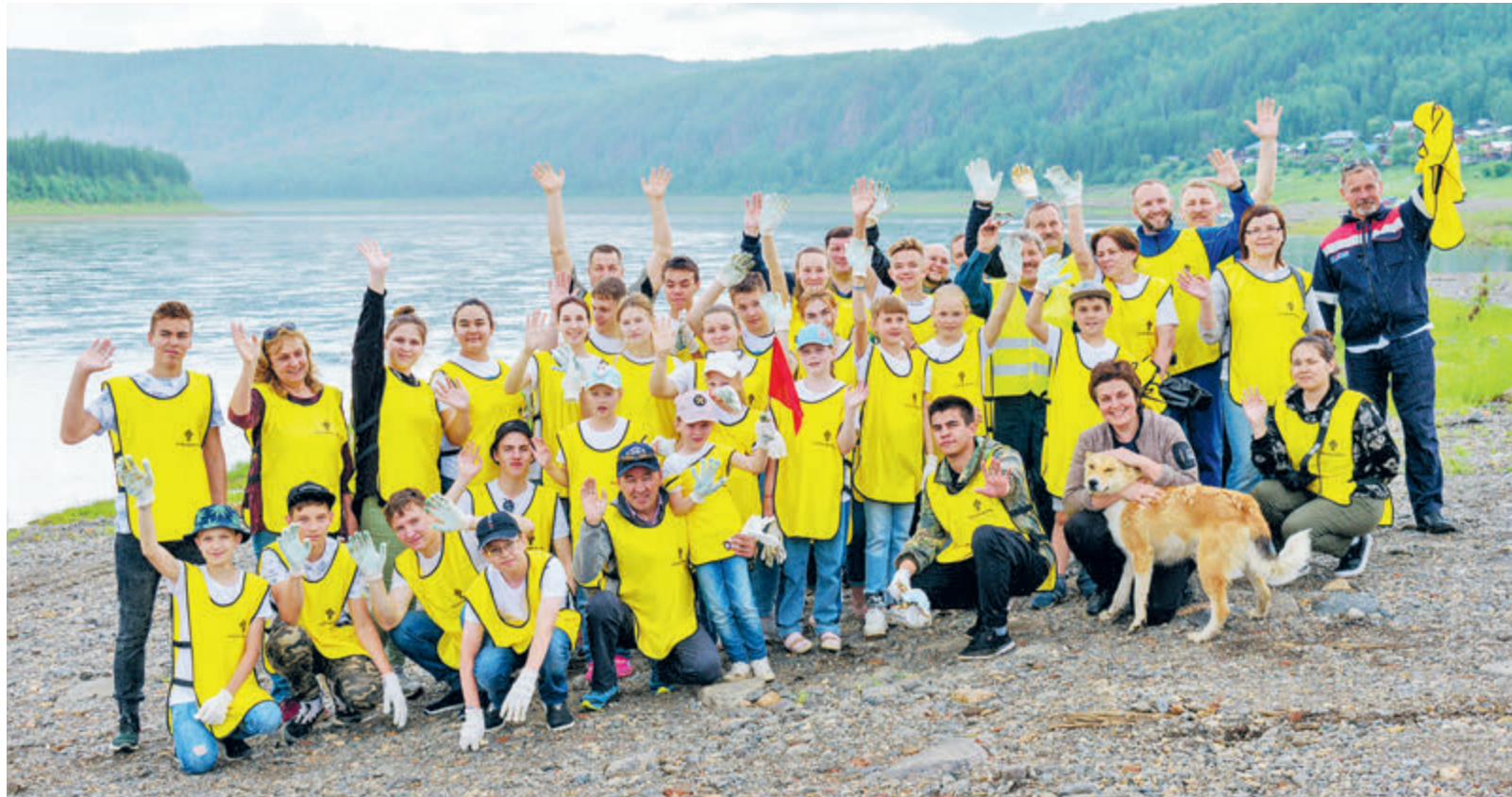
«Роснефть» является одной из самых активных и социально ответственных компаний в области «зеленых» инициатив.

Внедрение энергосберегающих технологий, оборудования и оптимизация расходов на энергоресурсы – ключевые направления программы энергосбережения. Объем топливно-энергетических ресурсов, сэкономленных компанией в рамках реализации программы по итогам 2022 года, составил 326 тысяч тонн условного топлива, или более 6 млрд рублей.