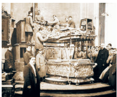
1922 год. Вскрытие раки.

весит гробница святого Александра Невского из серебра – уникальное и очень хрупкое произведение ювелирного искусства