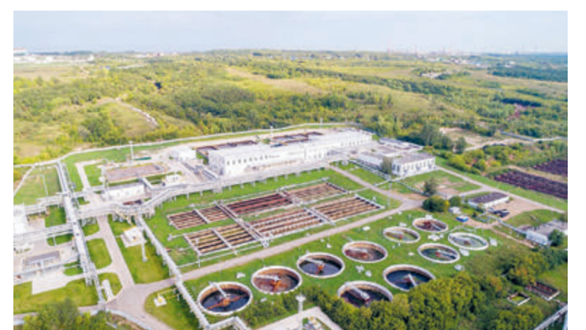
Биологические очистные сооружения (БОС) «Башнефть» – «Башнефть-Уфанефтехим» – крупнейший подобный комплекс в Евразии.

Суммарно на повышение экологичности своего бизнеса за последние пять лет «Роснефть» направила около 260 млрд рублей. ■