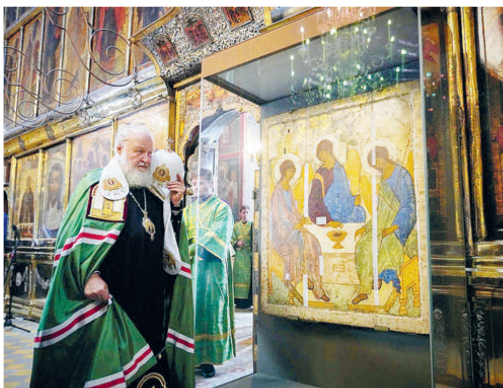
Патриарх Кирилл у рублевской «Троицы».